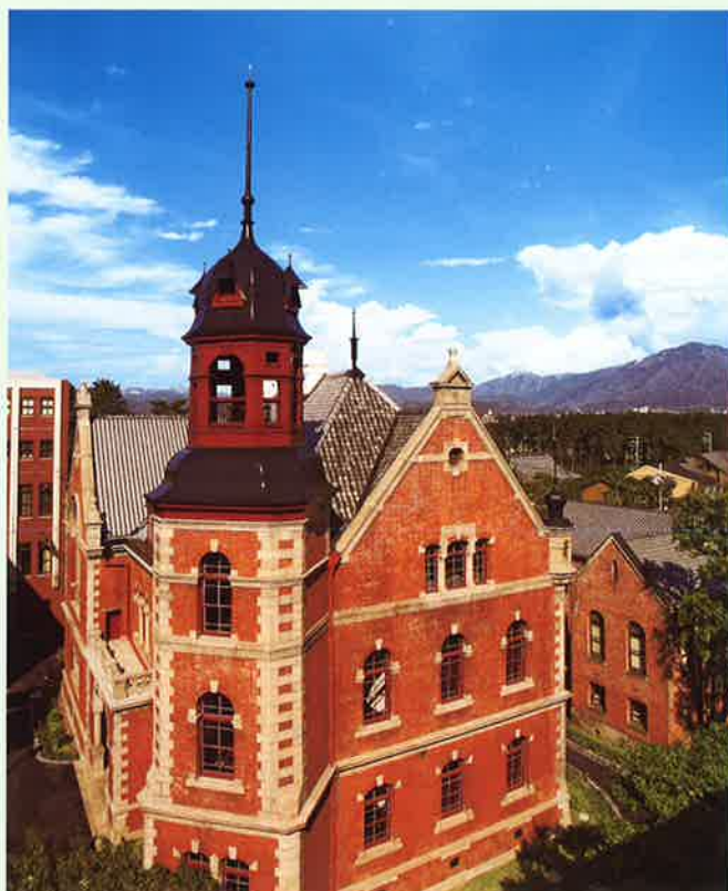
蘇った同志社人の誇り 同志社クラーク記念館

本会は同志社大学商学部(高商・経専を含む)及び大学院商学研究科の卒業生たるの自覚と同志社建学の精神をもって社会に貢献し、母校の更なる発展と学問水準の向上に寄与せんことを期す。 (平成13年10月17日制定)