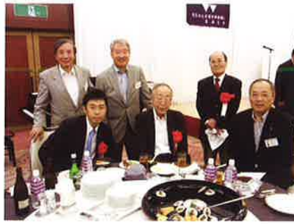
来賓の皆様を囲んで