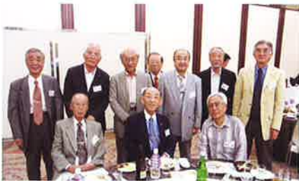
校友が集えば自然と笑みがこぼれます