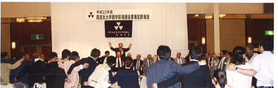
樹徳会本部樋口副理事長の音頭で同志社チャー