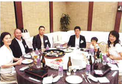
ご家族で出席の方も