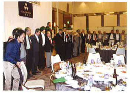
肩を寄せ合ってカレッジソング