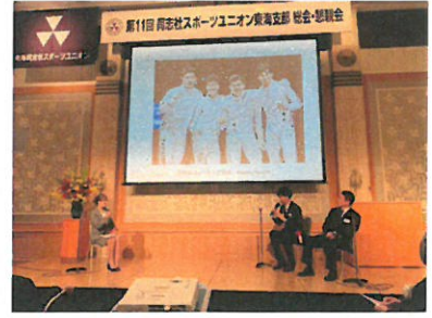
総会・トークショー