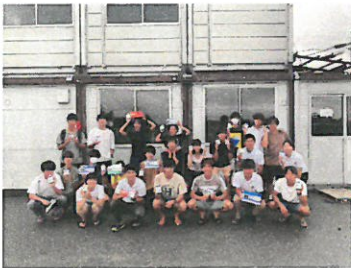
ボードセーリング部