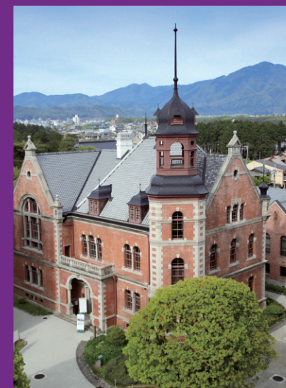
蘇った同志社人の誇り 同志社クラーク記念館